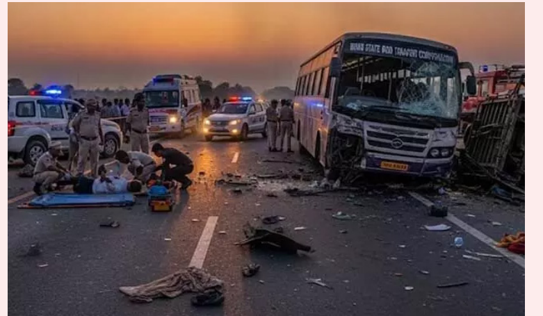
మొదట్ జిల్లా తూప్రాన్ మున్సిపల్ లోని 16 వ వార్డులో ఇటీవల విద్యుత్ ఉద్వేగం వల్ల మౌలిక తరువుల వైఫల్యం వల్ల వచ్చిన అగ్గి ప్రమాదం వల్ల బస్సులోని యాత్రికులు మృత్యువేదులయ్యారు.