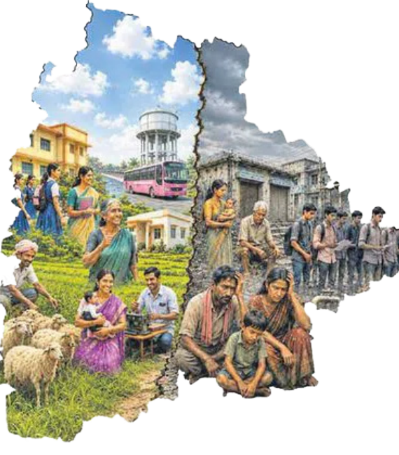
హైదరాబాద్, (ప్రజాస్వరం): విద్య, వైద్యం, ఉపాధి రంగాల్లోనూ నూతన ఆవిష్కరణలకు చిరునామాగా తెలంగాణను మార్చడంలోనూ ఎలాంటి అతిశయోక్తి లేదు. రైతుబంధు, రైతుబీమా, కేసీఆర్ కిట్, కల్యాణలక్ష్మి, షాదీముబారక్, గురుకుల విద్యాలయాలు, ఉచిత విద్యుత్తు, గొర్లు, చేపల పంపిణీ, దళితబంధు, గృహలక్ష్మి, బీసీ బంధు, మైనార్టీ బంధు ఇలా చెప్పుకొంటూ పోతే ఎన్నో సంక్షేమ పథకాలు ఉదాహరణగా నిలుస్తాయి. కేసీఆర్ ప్రవేశపెట్టిన పథకాలన్నీ ప్రత్యక్షంగా ఆయా వర్గాలకు లబ్ధి చేకూర్చడంతో పాటు, పరోక్షంగా రాష్ట్ర ప్రతిగది దోహదపడ్డాయి. బాల్య వివాహాలు, ..మిగతా 2లో

దేశానికే దిక్సూచిగా నిలిచిన బీఆర్ఎస్ మానవీయ పథకాలు అన్ని రంగాల్లో సమూల మార్పునకు గొప్ప పునాదులు పనిచేస్తున్నాయి. పంపిణీ పనుల ముసలి వరకూ దక్కిన ఫలాలు ప్రజాపాలనంటూ గద్దెనెక్కి పథకాలకు రేవంట్ తిలోదకాలు తెలంగాణ రాష్ట్ర ఆవిర్భావం నుంచి అప్పటి ముఖ్యమంత్రి కేసీఆర్ అప్పటికప్పుడు అనేక విప్లవాత్మక పథకాలకు శ్రీకారం చుడుతూ పేద, బడుగు బలహీనవర్గాల సంక్షేమానికి కొత్త బాటలు వేశారు. దేశానికి కొత్తదారి చూపారు. సంక్షేమ రంగంలో విమాత్య సంస్కరణలకు నాంది పలికారు. పదేళ్ల పాలనలో దేశంలో ఎక్కడా లేని విధంగా, గతంలో ఏ రాజకీయ పార్టీ చేపట్టిన విధంగా కనీసం అరుగు రీతిలో ఎస్సీ, ఎస్టీ, బీసీ, మైనారిటీలు, మహిళలు, వృద్ధులు, దివ్యాంగులు, అనాథలు, రింగమార్కెట్ వ్యక్తులు ఇలా సమాజంలోని ప్రతి వర్గానికి ఏదో ఒక లబ్ధి చేకూర్చేలా అప్పటి కేసీఆర్ ప్రభుత్వం పథకాలు రూపొందించి అమలు చేయడం విశేషం.