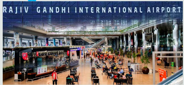
హైదరాబాద్, (ప్రజాస్వరం): శంషాబాద్ అంతర్జాతీయ విమానాశ్రయంలో ఎబోలా వైరస్ కు సంబంధించి హిస్టరీ ఉన్న ప్రయాణికుడిని గుర్తించడంతో వైద్య అధికారులు అప్రమత్తమయ్యారు. సూడాన్ నుంచి వచ్చిన ..మిగతా 2లో

ఐసోలేషన్ కు ప్రయాణికుడు తరలింపు స్టాండ్ కేంద్రంలో ప్రయాణికుడికి పరీక్షలు వెంటనే ఐసోలేషన్ కు తరలించిన వైద్య సిబ్బంది గాంధీ ఆసుపత్రిలో ప్రత్యేక ఐసోలేషన్ ఏర్పాటు శాంపిల్స్ సీసీఎంబీకి పంపిన వైద్యులు అధికారుల్లో అప్రమత్తత పెరిగిన పరిస్థితి సూడాన్ నుంచి వచ్చిన ప్రయాణికుడిపై పరిశీలన ఆరోగ్య శాఖ ప్రత్యేక నిఘా ప్రారంభం