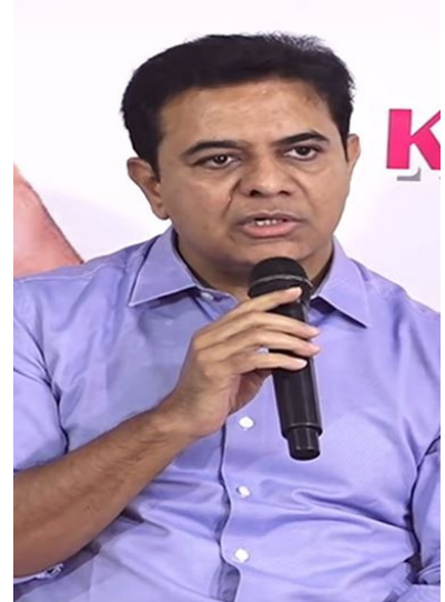
గౌరవించాల్సిందే. ఖచ్చితంగా తెలంగాణ భూమిపుత్రుల జాగీరే. ఈ రాష్ట్రం కోసం జరిగిన పోరాటాన్ని ఎవరూ తక్కువ చేసి చూడలేరు' అని కేటీఆర్ పైర్ అయ్యాడు.

ఎవరి దగ్గర పాఠాలు నేర్చుకోవాల్సి అవసరం లేదు. కేంద్రంలో సరేంద్ర మోడీ ప్రభుత్వం అధికారంలోకి వచ్చిన తర్వాత అనేక పరిశ్రమలు గుజరాత్ కు వెళ్లిపోయాయి. అదే సమయంలో విశాఖ ఉక్కు కర్మాగారం ప్రైవేటీకరణకు వ్యతిరేకంగా జరిగిన ఉద్యమానికి మేము మద్దతు ఇచ్చాము' అని కేటీఆర్ గుర్తు చేశారు. 'పవన్ కళ్యాణ్ ను ఉప ముఖ్యమంత్రిగా గౌరవిస్తాం, నటుడిగా అభిమానిస్తాము. పవన్ ఇంటికి వస్తే బిర్లాన్ పబ్లిక్ మార్కెట్ చేస్తాం. కానీ మా సచివాలయంలో కూర్చోని తెలంగాణ గురించి తక్కువ చేసి మాట్లాడితే ఊరుకోం. పవన్ కళ్యాణ్ ఓజీ సినీమా చేశారు. తెలంగాణకు అసలేవని ఓజీ కేసీఆర్, తెలంగాణ ఒక్క ఓజీ చాలు, ఇంకొకరు అవసరం లేదు. తెలంగాణ రాష్ట్రం కోసం అమరజీవి పోల్డీ శ్రీరాములు చేసిన ఆమరణ దీక్ష కూడా ప్రాంతీయవాదమేనా? తెలంగాణ ఉద్యమం కూడా ప్రజల ఆకాంక్షల కోసం జరిగిన పోరాటమే. దానిని తప్పుగా చిత్రించడం సరికాదు. దేశభక్తి విషయంలో మాకు