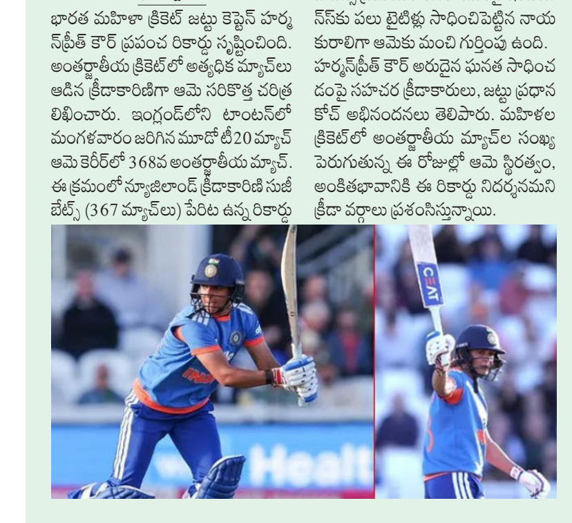
భారత మహిళా క్రికెట్ జట్టు కెప్టెన్ హార్సన్ ప్రీమ్ కౌర్ ప్రపంచ రికార్డు సృష్టించింది. అంతర్జాతీయ క్రికెట్ లో అత్యధిక మ్యాచ్ లు హార్సన్ ప్రీమ్ కౌర్ ఆరుదైన ఘనత సాధించడంపై సహచర క్రీడాకారులు, జట్టు ప్రధాన కోచ్ అభినందనలు తెలిపారు. మహిళల మంగళవారం జరిగిన మూడో టీ20 మ్యాచ్ ఆమె కెరీర్ లో 368వ అంతర్జాతీయ మ్యాచ్. ఈ క్రమంలో న్యూజిలాండ్ క్రీడాకారిణి సుజీ బేట్సెన్ (367 మ్యాచ్ లు) పేరిట ఉన్న రికార్డు

సు హార్సన్ ప్రీమ్ అధిగమించారు. ఈ జాబితాలో సుజీ బేట్సెన్ రెండో స్థానంలో ఉండగా, ఆస్ట్రేలియాకు చెందిన ఎల్లిస్ పెర్రీ (357 మ్యాచ్ లు) మూడో స్థానంలో కొనసాగుతున్నారు. 2009లో అంతర్జాతీయ అరంగేట్రం చేసిన 37 ఏళ్ల హార్సన్ ప్రీమ్, ఇప్పటివరకు 7 టెస్టులు, 164 వన్ డేలు, 197 టీ20 మ్యాచ్ లు ఆడాడు. ఆమె పంజాబ్ కు చెందిన ఆల్ రౌండ్ ర్. ఇంగ్లండ్ లో జరిగిన టీ20 సిరీస్ ను భారత్ 12 టెస్టు కోట్ల యొక్క టీ20, నిర్ణయాత్మక మైన ఆఖరి మ్యాచ్ లో హార్సన్ ప్రీమ్ హాఫ్ సెంచర్ తో రాణించడం విశేషం. 2025లో భారత జట్టుకు తొలిసారిగా మహిళల ప్రపంచకప్ అందించిన కెప్టెన్ గా, అలాగే విమెన్స్ ప్రీమియర్ లీగ్ లో మంబై ఇండియన్స్ కు పలు టైటిళ్లు సాధించిపెట్టిన నాయకత్వంలో ప్రపంచ రికార్డు సృష్టించింది. అంతర్జాతీయ క్రికెట్ లో అత్యధిక మ్యాచ్ లు హార్సన్ ప్రీమ్ కౌర్ ఆరుదైన ఘనత సాధించడంపై సహచర క్రీడాకారులు, జట్టు ప్రధాన కోచ్ అభినందనలు తెలిపారు. మహిళల మంగళవారం జరిగిన మూడో టీ20 మ్యాచ్ ఆమె కెరీర్ లో 368వ అంతర్జాతీయ మ్యాచ్. ఈ క్రమంలో న్యూజిలాండ్ క్రీడాకారిణి సుజీ బేట్సెన్ (367 మ్యాచ్ లు) పేరిట ఉన్న రికార్డు