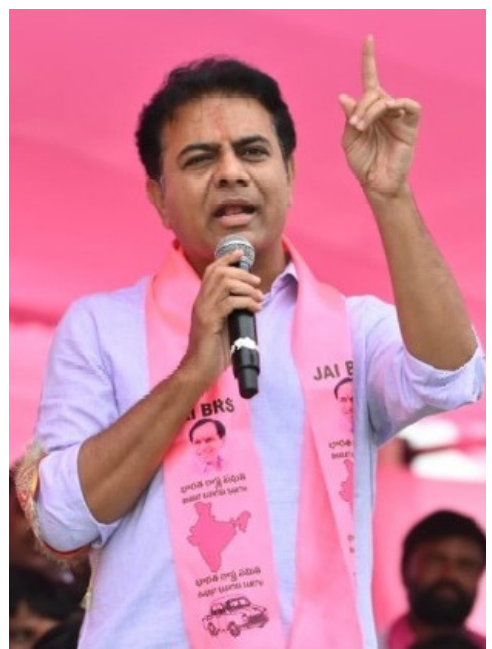
హైదరాబాద్, (ప్రజాస్వరం): తెలంగాణలో రాజకీయ వాతావరణం మరింత వేడెక్కుతోంది. బీఆర్ఎస్ కార్యనిర్వాహక అధ్యక్షుడు కేటీఆర్ కాంగ్రెస్ ప్రభుత్వంపై తీవ్ర విమర్శలు గుప్పించారు. ముఖ్యమంత్రి రేవంత్ రెడ్డి రైతుల గురించి మాట్లాడటంలో మాత్రమే పరిమితమవుతున్నారని, అమలులో మాత్రం విఫలమవుతున్నారని ఆరోపించారు. రైతు భరోసాపై ప్రశ్నలు రైతులపై నిజంగా ప్రేమ ఉంటే 'రైతు భరోసా'ను వాయిదా లుగా ఎందుకు ఇస్తున్నారని కేటీఆర్ ప్రశ్నించారు. రైతులకు ఆర్థిక భరోసా కల్పించే పథకాలు ..మిగతా 2లో

రైతు భరోసా నిధులు ఎందుకు ఇస్తలేరు బీఆర్ఎస్ వర్కింగ్ ప్రెసిడెంట్ కేటీఆర్ తెలంగాణ భవన్ లో బీఆర్ఎస్ లో చేరికల కార్యక్రమం కాంగ్రెస్ సర్కారుపై కేటీఆర్ తీవ్ర విమర్శలు రైతు బంధు అమలుపై ప్రశ్నల వర్షం యూరియా కొరతపై ప్రభుత్వాన్ని నిలదీత ఓటమి తర్వాత పార్టీ పరిస్థితులపై వ్యాఖ్యలు ఎమ్మెల్యేల మార్పులు, ఎంపీ సీట్లపై అసంతృప్తి ఎస్పీ, ఎస్సీల ఇళ్ల హామీలపై విమర్శ ఓపీఐ రియింబర్స్ మెంబర్ నిధుల నిలుపుదలపై ఆరోపణ విద్యార్థులు, రైతులు ఇబ్బందులు పడుతున్నారని వ్యాఖ్య