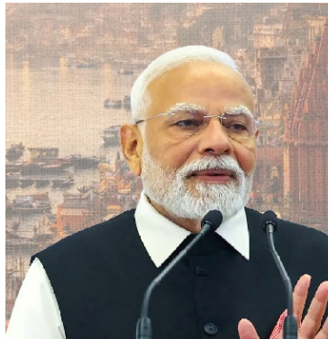
దగ్గరే ఉపాధి లభిస్తుందని మోడీ వివరించారు. సమాజ్ వాదీ పార్టీ మరియు దాని మిత్రపక్షాల పట్ల ఉత్తర ప్రదేశ్ ప్రజలు అప్రమత్తంగా ఉండాలని, అభివృద్ధిని అడ్డుకునే శక్తులకు మళ్ళీ అవకాశం ఇవ్వద్దని ప్రధాని మోడీ ఈ సభా ముఖంగా పిలుపునిచ్చారు. ప్రధాని ప్రసంగం పొడవునా ప్రజల నుంచి 'మోడీ మోడీ' అనే నినాదాలు మిన్నంటాయి.

కొత్త ప్రదేశ్ రాష్ట్ర అభివృద్ధి గురించి ప్రస్తావించినప్పుడు.. ఒకప్పుడు రోడ్లను గుంతులకు పేరుగాంచిన రాష్ట్రం నేడు ఎక్స్ ప్రెస్ వేల రాష్ట్రంగా మారిందని మోడీ కొనియాడారు. డబుల్ ఇంజన్ ప్రభుత్వం (కేంద్రం మరియు రాష్ట్రంలో ఒకే పార్టీ పాలన) వల్ల యూపీ అభివృద్ధి పథంలో దూసుకుపోతోందని చెప్పారు. హార్ యే, ఉన్నా వంటి జిల్లాల్లో పారిశుధ్యం కాంక్షలు వస్తాయని గత ప్రభుత్వాల హయాంలో ఎవరూ ఊహించలేదని, బీజేపీ ప్రభుత్వం ఆ కలను సాకారం చేస్తోందని అన్నారు. గతంలో వెనుకబడిన రాష్ట్రంగా (బీహారు రాష్ట్రంగా) ముద్దుపడిన ఉత్తర ప్రదేశ్, నేడు ఒక ట్రి లియన్ డాలర్ అర్థిక వ్యవస్థ దిశగా అడుగులు వేస్తోందని ప్రధాని గర్వంగా ప్రకటించారు. ఇది కేవలం మాటలు కాదని, పక్కా ప్రణాళికతో జరుగుతున్న కృషి అని ఆయన స్పష్టం చేశారు. యూపీలో ఉన్న యువశక్తిని దేశ నిర్మాణంలో భాగస్వాములను చేస్తామని, రాష్ట్రాన్ని గ్లోబల్ మాన్యుఫ్యాక్చరింగ్ హబ్గా మారుస్తామని హామీ ఇచ్చారు. భారీ పెట్టుబడుల ద్వారా కొత్త పరిశ్రమలు రావడం వల్ల యువతకు ఇంటి