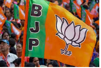
హైదరాబాద్, (ప్రజాస్వరం): తెలంగాణ రాజకీయాల్లో కీలక పరిణామంగా భావిస్తున్న బహిరంగ సభకు భాజపా ఏర్పాటు చేగవంతం చేసింది. మే 10న హైదరాబాద్ లోని వరేడ్ గ్రౌండ్స్ లో నిర్వహించనున్న ప్రధాని నరేంద్ర మోదీ బహిరంగ సభకు 'జనాగ్రహ సభ'గా నామకరణం చేసినట్లు భాజపా రాష్ట్ర అధ్యక్షుడు ..మిగతా 2లో