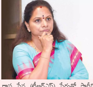
రాష్ట్ర సేన (టీఆర్ఎస్) పేరుతో పార్టీని స్థాపించిన విషయం తెలిసింది. పాతికేళ్ల క్రితం కేసీఆర్ స్థాపించిన బీఆర్ఎస్ సంక్షిప్త నామం వచ్చేలా ఆమె పార్టీని ప్రకటించారు.

తన పార్టీకి నష్టం జరుగుతుందని ఎన్నికల సంఘానికి లేఖ రాశారు. తన బీఆర్ఎస్ పార్టీని ఎన్నికల సంఘం 2023లో రిజిస్టర్ చేసినట్లు ఆ లేఖలో పేర్కొన్నారు. గత అసెంబ్లీ ఎన్నికల్లో గ్యాన్ సిలిండర్ గుర్తుతో పది నియోజకవర్గాల్లో పోటీ చేసినట్లు వెల్లడించారు. సిద్దిపేట జిల్లాకు చెందిన తుపాకుల బాలరంగం 'టీఆర్ఎస్' సంక్షిప్త నామంతో పార్టీని స్థాపించారు. బహుజనపల్లం రాజ్యాధికారం లక్ష్యంగా పార్టీని స్థాపించారు. సంక్షిప్త కవిత నాలుగు రోజుల క్రితం తెలంగాణ