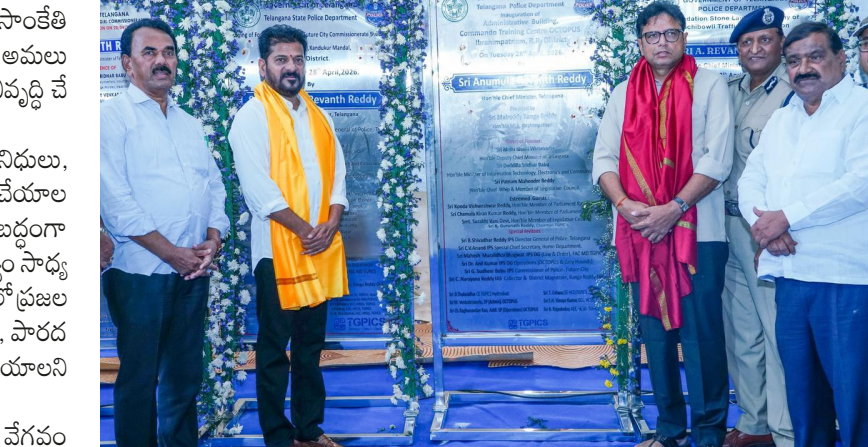
మలు, సేవా రంగాల్లో పెట్టుబడులు ఆకర్షించే కేంద్రంగా ఈ నగరం ఎదుగుతుందని చెప్పారు. ప్రపంచ స్థాయి నగరాలతో పోటీపడేలా ఫ్యూచర్ సిటీని తీర్చిదిద్దడమే లక్ష్యమని స్పష్టం చేశారు. ఈ కార్యక్రమంలో మంత్రులు, ప్రజా ప్రతినిధులు, ఉన్నతాధికారులు పాల్గొన్నారు. ఫ్యూచర్ సిటీ అభివృద్ధి ప్రణాళికపై అధికారులతో సీఎం విస్తృతంగా చర్చించారు. ప్రాజెక్ట్ అమలులో ఎదురయ్యే సమస్యలను ముందుగానే గుర్తించి పరిష్కరించేందుకు

ప్రభుత్వ లక్ష్యమని చెప్పారు. నూతన సాంకేతికత ఆధారిత పోలీసింగ్ విధానాలను అమలు చేస్తూ, స్మార్ట్ సెక్యూరిటీ సిస్టమ్ ను అభివృద్ధి చేయనున్నట్లు తెలిపారు. ఫ్యూచర్ సిటీ అభివృద్ధిలో ప్రజా ప్రతినిధులు, అధికారులు సమన్వయంతో పనిచేయాలని సీఎం సూచించారు. ప్రణాళికాబద్ధంగా ముందుకు సాగితేనే ఈ మహాత్మర లక్ష్యం సాధ్యమవుతుందని అన్నారు. ప్రతి నిర్ణయంలో ప్రజల అభిప్రాయానికి ప్రాధాన్యం ఇవ్వాలని, పౌరదర్శక విధానాలతో ప్రాజెక్టును అమలు చేయాలని అధికారులను అడిగింపారు. ఈ ప్రాజెక్ట్ వల్ల ప్రాంతీయ అభివృద్ధి వేగవంతమవుతుందని సీఎం పేర్కొన్నారు. గ్రామీణ ప్రాంతాలు పట్టణ సదుపాయాలను పొందేలా మారుతాయని, జీవన ప్రమాణాలు మెరుగుపడతాయని చెప్పారు. రైతులు, స్థానిక ప్రజలకు తగిన పరిహారం, పునరావాసం కల్పిస్తూ సమగ్ర అభివృద్ధిని సాధిస్తామని హామీ ఇచ్చారు. ఫ్యూచర్ సిటీ ద్వారా తెలంగాణ రాష్ట్రం దేశ వ్యాప్తంగా ప్రత్యేక గుర్తింపు పొందుతుందని సీఎం విశ్వాసం వ్యక్తం చేశారు. ఐటీ, పరిశ్ర