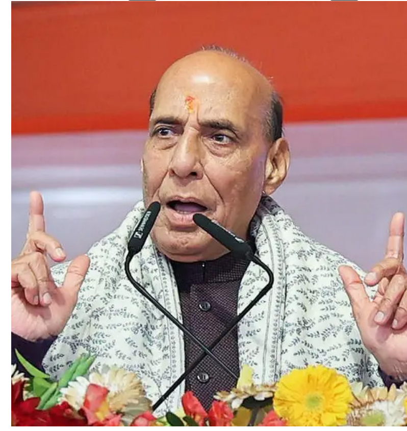
సింగ్ చేసిన పిలుపు ప్రాధాన్యం సంతరించు కుంది.

తీసుకోవడంలో ఎన్సీఓ దేశాలు వెనుకాడకూడదని పిలుపునిచ్చారు. ఇక ప్రపంచవ్యాప్తంగా కొనసాగుతున్న ఘర్షణలపై ప్రకాశా ఆయన ఆందోళన వ్యక్తం చేశారు. గత కొన్నేళ్లుగా జరిగిన యుద్ధాలు, ఘర్షణల్లో అనేక మంది ప్రాణాలు కోల్పోయారని, భారీ ఆస్తి నష్టం వాటిల్లిందన్నారు. ఈ పరిస్థితుల్లో ఉగ్రవాద బెదిరింపులను ఎదుర్కొనేందుకు భారత్ సిద్ధంగా ఉందని ఆయన స్పష్టం చేశారు. ఇక ఉద్రిక్తతల పరిష్కారానికి దౌత్య మార్గాలనే అనుసరించాలని ఆయన సూచించారు. సంభాషణ, చర్యల ద్వారానే దీర్ఘకాలిక శాంతి సాధ్యమవుతుందని పేర్కొన్నారు. ప్రపంచ దేశాలు కలిసి పనిచేస్తేనే ఉగ్రవాదాన్ని పూర్తిగా నిర్మూలించగలమని ఆయన అభిప్రాయపడ్డారు. ప్రపంచ రక్షణరంగంలో భారత్ కీలక స్థానంలో ఉందని రాజ్ నాథ్ సింగ్ తెలిపారు. రక్షణ వ్యయంలో ప్రపంచంలోని అగ్రదేశాల్లో భారత్ స్థానం సంపాదించిందని పేర్కొన్నారు. భద్రతా అవసరాల దృష్ట్యా రక్షణ రంగాన్ని మరింత బలోపేతం చేస్తున్నామని తెలిపారు. మొత్తంగా, ఎన్సీఓ వేదికగా భారత్ ఉగ్రవాదంపై తన కఠిన వైఖరిని మరోసారి ప్రపంచానికి చాటింది. ఉగ్రవాదాన్ని నిర్మూలించేందుకు అంతర్జాతీయ సహకారం అవసరమని రాజ్ నాథ్