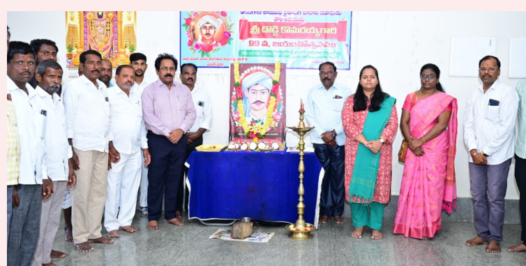
దొడ్డి కొమరయ్య పోరాట స్మారక మునందలికీ ఆదర్శం..

షయాన్ని ప్రజలు గమనిస్తున్నారు.. అందుకే ఆ పార్టీని దూరం పెడుతున్నారు. ఇప్పటికీ పుష్పం ఎన్నికలు జరిగినా కాంగ్రెస్ పార్టీ క్లీన్ స్లీప్ చేస్తుంది. రాష్ట్రంలో 100 సీట్లు ఖాయం అని అన్నారు. బీజేపీ కులం, మతం పేరుతో రాజకీయాం చేస్తోందని.. ఆ పార్టీకి తెలంగాణలో స్థానం లేదని విమర్శించారు. రాముడేమైనా బీజేపీ జాగిరా.. వాళ్ల పార్టీల సభ్యత్వం ఏమైనా ఉందా అని ప్రశ్నించారు. దేశంలో ఎక్కడా లేనట్లుగా తెలంగాణలో ప్రభుత్వ పథకాలను కార్యక్రమ ప్రజల్లోకి తీసుకెళ్లాలని సూచించారు. పార్టీ కోసం కష్టపడిన వారికి తగిన గుర్తింపు ఉంటుందని అన్నారు. క్షేత్ర స్థాయిలో పార్టీ బలోపేతానికి అందరూ కృషి చేయాలన్నారు. సన్నబియ్యం పథకం దేశంలోనే చారిత్రాత్మకమన్నారు. బీఆరెఎస్ చేసిన అప్పులు కాంగ్రెస్ కడుతోందన్నారూ. బీఆరెఎస్ హయాంలో నేతల జేబుల్లోకి డబ్బులు వెళ్లాయన్నారు. మహిళలకు స్త్రీ బస్సు స్కీం సకెస్ గా నడుస్తోందన్నారు. బీజేపీ రాష్ట్రంలో సన్నబియ్యం ఎందుకు ఇవ్వలేదన్నారు. కేంద్రం రాజ్యాల్లో ఉన్న సంస్థలను అమ్మేస్తోందని విమర్శించారు. 12 ఏండ్లలో కేంద్రం ప్రజలకు ఏం చేసిందో చెప్పాలని ప్రశ్నించారు మహేశ్ కమార్ గౌడ్. ఇందిరాంధీ నుంచి రాహుల్ వరకు పేదల కోసం పనిచేస్తున్నారని అన్నారు. బీఆరెఎస్ చీఫ్ కేసీఆర్ ఫ్యామ్ హౌస్ కే పరిమితమయ్యారని అన్నారు. దోచుకున్న సొత్తులో వాటాల గొడవలతో ఆ పార్టీ రోడ్డున పడిందని విమర్శించారు. వచ్చే ఎన్నికల్లో కాంగ్రెస్ కు 100 సీట్లు గ్యారంటీ అని ధీమా వ్యక్తం చేశారు. గ్రౌబల్ సమిట్ తో 5 లక్షల కోట్ల డబ్బులను జరిగాయన్నారు. ప్రతి పేదవాడికి ఇందిరమ్మ ఇండ్లు ఇస్తున్నామని చెప్పారు మహేశ్ కమార్ గౌడ్. ఈ కార్యక్రమంలో మంత్రి వివేకేశ్ పాట స్థానిక నేతలు పాల్గొన్నారు.