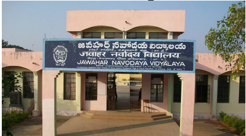
అదిలాబాద్ జిల్లాలో ఏర్పాటు కల సాకరమయ్యేనా?

ప్రాంతంలోనే కొలువై ఉన్నప్పటికీ సరైన విద్యార్థులను లేక జిల్లా వాసులు నాణ్యమైన చదువుల కోసం అప్పకవ్వాల మధ్య జిల్లాను దాటి వెళ్తున్నారు. మరికొంతమంది ఆర్థిక భారం, దూరభారం వలన మధ్యలోనే చదువులకు స్వస్తి పలుకుతున్నారు. తెలంగాణలో ఉన్న పాత పది జిల్లాల్లో యూనివర్సిటీ లేని ఏకైక జిల్లాగా ఉమ్మడి అదిలాబాద్ జిల్లా నిలిచింది. గిరిజన యూనివర్సిటీ, మైనింగ్ యూనివర్సిటీ లలో ఏదో ఒకటి కచ్చితంగా ఉమ్మడి అదిలాబాద్ జిల్లాకు కేటాయిస్తారని ప్రచారం జరిగింది. సాక్షాత్తు రాష్ట్ర ముఖ్యమంత్రి రేవంత్ రెడ్డి అదిలాబాద్ జిల్లా పర్యటనలో భాగంగా జిల్లా కేంద్రంలో జరిగిన ఓ సభలో త్వరలోనే అదిలాబాద్ జిల్లా లో యూనివర్సిటీని ఏర్పాటు చేస్తామని ప్రకటించారు. కానీ నేటికీ జిల్లాలో యూనివర్సిటీ ఏర్పాటుపై స్పష్టత కరవైంది. ఉమ్మడి అదిలాబాద్ జిల్లాలో ఏర్పాటు చేస్తారనుకున్న గిరిజన యూనివర్సిటీని ఉమ్మడి వరంగల్ జిల్లాలో, మైనింగ్ యూనివర్సిటీని ఉమ్మడి ఖమ్మం జిల్లాలో ఏర్పాటు చేశారు. గత అసెంబ్లీ ఎన్నికల్లో ఉమ్మడి అదిలాబాద్ జిల్లా నుండి నలుగురు ఎమ్మెల్యేలు, పార్లమెంట్ ఎన్నికలలో ఎంపీ గా బిజేపీ అభ్యర్థులు గెలిచినప్పటికీ కేంద్ర ప్రభుత్వం విద్యాలయాల ఏర్పాటులో జిల్లాను విస్తరించడంపై సర్వత్ర విమర్శలు వ్యక్తం అవుతున్నాయి.