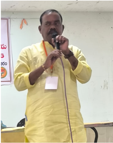
పతంగి బ్రహ్మాండం మరియు వ్యవస్థా ప్రముఖ జివి రమణ గారు మరియు మండలాల అధ్యక్షులు నాయకులు కార్యకర్తలు పాల్గొన్నారు

సోనాల మండలంలో బిజెపి రాష్ట్ర, మరియు జిల్లా పార్టీ అధికారసారా "పండిట్ దీప్తయ్య ప్రశిక్షణ శిబిరం" కార్యక్రమం ఏర్పాటు లో భాగంగా మూడు మండలాలూ (బోధ్, సోనాల, బజార్ హత్యార్) కలసి సోనాలలో (మున్నూరు కాపు సంఘ భవనం) లో శిక్షణ శిబిరం కార్యక్రమం ఏర్పాటు చేయడం జరిగింది. ఈ శిక్షణ శిబిరంలో మండల లోని తాజా, మాజీ ప్రజా ప్రతినిధులు శక్తి కేంద్ర ఇంచార్జీ లు బాత్ అధ్యక్షులు పార్టీ యొక్క సీనియర్ నాయకులు కార్యకర్తలు పాల్గొన్నారు. ఈ శిక్షణ శిబిరంలో పార్టీ యొక్క స్థితిగతులు మరియు పార్టీ ఎలా స్థాపించబడింది. పార్టీ యొక్క ముఖ్యమైన విషయాలు పార్టీ బలోపేతానికి చేయవలసిన కార్యక్రమాల గురించి మాట్లాడడం జరిగింది. ఈ శిక్షణ శిబిరానికి బిజెపి జిల్లా అధ్యక్షులు