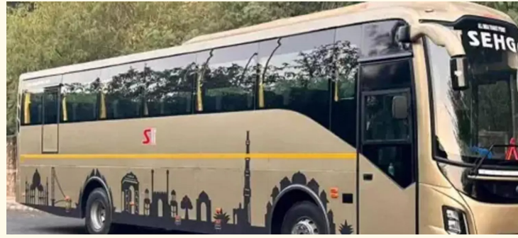
విశాఖ, ప్రజాస్వరం :

దేశవ్యాప్తంగా పెరుగుతున్న బస్సు ప్రమాదాలపై జాతీయ మానవ హక్కుల కమిషన్ (NHRC) తీవ్ర ఆందోళన వ్యక్తం చేసింది. ముఖ్యంగా ప్రైవేటు స్టీవర్ బస్సుల్లో భద్రతా లోపాలపై దృష్టి సారించి, నిబంధనలు పాటించని వాటిని అనుమతించవద్దని రాష్ట్రాలకు కీలక సూచనలు చేసింది. ఈమేరకు రాష్ట్రాల సీఎస్ ఐలు ఆదేశాలు జారీ చేసింది. ప్రమాదాల్లో ప్రయాణికులు సజీవ దహనమవుతున్న ఘటనలపై పిటిషన్లు లేవనెత్తిన అంశాలను పరిగణనలోకి తీసుకుని ఈ ఆదేశాలు జారీ చేసి నట్లు జాతీయ మానవ హక్కుల కమిషన్ తెలిపింది. రెండు తెలుగు రాష్ట్రాల్లో కాక దేశవ్యాప్తంగా నిత్యం ఏదో చోట బస్ ప్రమాద ఘటనలు వెలుగు చూస్తూనే ఉన్నాయి. వీటిలో ఎక్కువ ప్రైవేటు ట్రావెల్స్ కు చెందిన బస్సులే ఉన్నాయి. ఈవరకు బస్సు ప్రమాదాలపై జాతీయ మానవ హక్కుల కమిషన్ (ఎన్ హెచ్ఆర్సీ) ఆందోళన వ్యక్తం చేసింది. ఈక్రమంలో ప్రైవేట్ బస్సుల్లో భద్రతపై ఆంధ్రప్రదేశ్, తెలంగాణ సహా దేశంలోని ప్రతి రాష్ట్రానికి కీలక సూచనలు చేసింది. నిబంధనలు పాటించని స్టీవర్ బస్సులను అనుమతించవద్దని.. వాటిని పక్కకు పెట్టాలని సూచించింది. ఈమేరకు ఆయా రాష్ట్రాల ప్రభుత్వ ప్రధాన కార్యదర్శులకు ఆదేశాలు జారీ చేసింది. గత కొన్ని రోజులుగా ఏపీ, తెలంగాణ రాష్ట్రాల్లో వరుసగా బస్సు ప్రమాదాలు వెలుగు చూశాయి. అలానే మహారాష్ట్ర, రాజస్థాన్ లో కూడా బస్సు యాక్సిడెంట్లు వెలుగు చూశాయి. వీటిపై జాతీయ మానవ హక్కుల కమిషన్ ఫిర్యాదులు అందడంతో.. ఎన్ హెచ్ఆర్సీ వీటిపై స్పందించింది. వీటిలో ఓ పిటిషన్ పై ఎన్ హెచ్ఆర్సీ సభ్యుడు ప్రియోంకర్ కనూంగ్