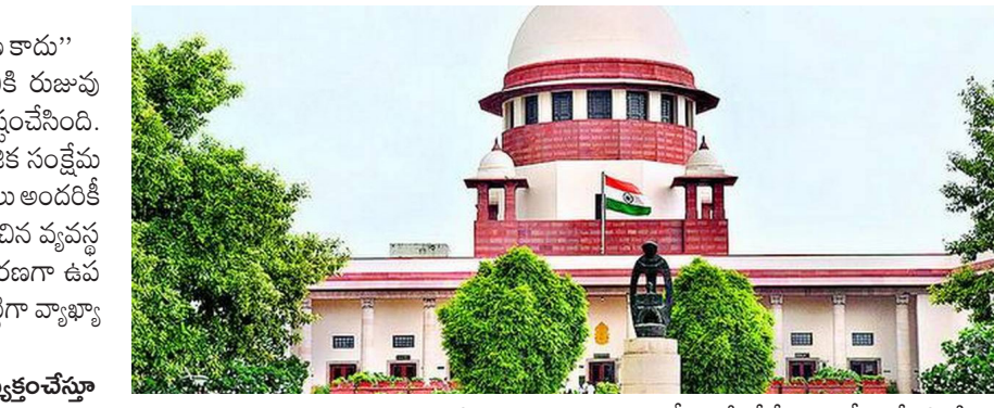
సమగ్ర సవరణ ప్రక్రియ సామాన్య పౌరులపై, ముఖ్యంగా నిర్దేశానులపై, పేదలపై అన్యాయమైన భారం మోపుతుందని ఆయన వాదించారు. "లక్షలాది మంది పౌరులు తమ పౌరసత్వాన్ని మళ్లీ మళ్లీ నిరూపించుకోవాల్సి వస్తుంది. ఇది రాజ్యాంగంలోని ఆర్టికల్ 14, 19, 21లకు విరుద్ధం. ఈ ప్రక్రియ ప్రజాస్వామ్యాన్ని దెబ్బతీసే ప్రమాదం ఉంది" అని కపిల్ సిబల్ ఆందోళన వ్యక్తం చేశారు. తమిళనాడు, కేరళ, పశ్చిమ బెంగాల్ రాష్ట్రాల్లో ఎన్నికల సంఘం చేపట్టబోతున్న ప్రత్యేక సమగ్ర సవరణ (ఎన్ఐఆర్) ప్రక్రియను నిలిపివేయాలని కోరుతూ ఈ మూడు రాష్ట్రాలకు

కేసులను విచారించింది. "ఆధార్ అంటే పౌరసత్వ దృవీకరణ కాదు" ఆధార్ కార్డు భారత పౌరసత్వానికి రుజువు కాదని సుప్రీంకోర్టు మరోసారి స్పష్టం చేసింది. "ఆధార్ కార్డు ప్రధానంగా సామాజిక సంక్షేమ పథకాలు, రేషన్, ఇతర ప్రయోజనాల అందరికీ అందేలా చూడడానికి రాబోయింది" వ్యవస్థ మాత్రమే. దాన్ని పౌరసత్వ దృవీకరణగా ఉపయోగించలేం" అని ధర్మాసనం గట్టిగా వ్యాఖ్యానించింది. అదే సందర్భంలో కోర్టు ఆంధ్రప్రదేశ్ వ్యక్తం చేస్తూ ఈ క్రింది ప్రశ్నలు సంబంధించి: రేషన్ కోసం ఆధార్ తీసుకున్న వ్యక్తిని ఓటర్ గా చేయాలా? విదేశీ పౌరులు ఇక్కడ కార్మికులుగా పనిచేస్తే వారికి కూడా ఓటు హక్కు ఇవ్వాలా? చొరబాటుదారులు ఆధార్ కార్డు పొందితే వారికి ఓటు హక్కు కల్పించాలా? ఓటరు నమోదు ఫారంలలో సమర్పించిన వివరాలు సత్యమైనవేనా, పౌరసత్వం ఉన్నవారి వేనా అని పరిశీలించి నిర్ణయం తీసుకునే పూర్తి అధికారం ఎన్నికల సంఘానికి ఉందని కోర్టు గుర్తుచేసింది. "ప్రజాస్వామ్యంపై దాడి" పిటిషన్ల తరఫున సీనియర్ న్యాయవాది కపిల్ సిబల్ వాదనలు వినిపించారు. ఈ ప్రత్యేక