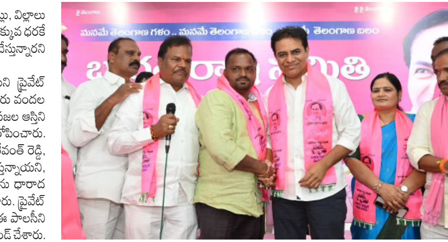
ట్రారు. గత ప్రభుత్వం 24 శాతం రిజర్వేషన్లు రిజర్వేషన్ల పేరుతో నాటకాలాడుతున్న కాంగ్రెస్ పార్టీకి బీసీ సోదరులు తగిన బుద్ధి మాత్రమే ఇచ్చి చేతులు దులుపుకుందని విమ

ఇప్పుడు ఆ భూముల్లో అపార్ట్ మెంట్లు, విల్లాలు కట్టుకునేందుకు రేవంట్ రెడ్డి అతి తక్కువ ధరకే అనుమతులు ఇస్తూ రియల్ డెవలపర్లను అనుమతించారు. దాదాపు 9300 ఎకరాల భూమిని ఫ్రైవేట్ వ్యక్తులకు ధారాదత్తం చేస్తూ, బదారు పందల మంది కోసం 5 లక్షల కోట్ల రాష్ట్ర ప్రజల ఆస్తిని తాకట్టు పెడుతున్నారని కేటీఆర్ ఆరోపించారు. ఈ వ్యవహారంలో సగం డబ్బులు రేవంట్ రెడ్డి, కాంగ్రెస్ నాయకుల జేబుల్లోకి వెళ్తున్నాయని, వారి అబ్బి సొత్తని ఈ భూములను ధారాదత్తం చేస్తున్నారని కేటీఆర్ ప్రశ్నించారు. ఫ్రైవేట్ వ్యక్తులకు భూములను అమ్మడేమీ ఈ పాలసీని వెంటనే వెనక్కి తీసుకోవాలని డిమాండ్ చేశారు. కాంగ్రెస్ పార్టీ అధికారంలోకి వస్తే బీసీలకు 42 శాతం రిజర్వేషన్లు ఇస్తామని హామీ ఇచ్చి, ఇప్పుడు మోసం చేసిందని కేటీఆర్ దుయ్యబ