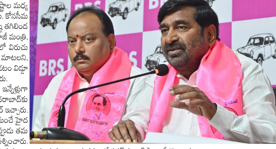
పండుగ 2.0' కార్యక్రమంలో పవన్ కల్యాణ్ పాల్గొన్నారు. ఈ సందర్భంగా ఆయన మాట్లాడుతూ, "పచ్చనీ కోసనీమకు తెలంగాణ నాయకుల దిష్టి తగిలింది. ఇక్కడి కొద్ది చిట్ల పచ్చనూని మానె బహుశా వారికి ప్రత్యేక రాష్ట్రం ఆలోచన వచ్చిందేమో" అని వ్యాఖ్యానించారు. నరుడి బుధవారం కోసనీమ జిల్లా రాజ్ కల్యాణ్ పల్లె పేర్కొన్నారు. పవన్ చేసిన ఈ వ్యాఖ్యలు సోషల్ మీడియాలో తీవ్ర చర్చనీయాంశం కాగా, జగదీష్ రెడ్డి తాజా ప్రతిస్పందనతో రాజకీయ వేడి మరింత పెరిగింది. ఈ మాటల యుద్ధం రెండు రాష్ట్రాల మధ్య ఎలాంటి పరిణామాలకు దారితీస్తుందోనని రాజకీయ వర్గాల్లో చర్చ జరుగుతోంది.

చేసిన 'దిష్టి' వ్యాఖ్యలు తెలుగు రాష్ట్రాల మధ్య రాజకీయ దుమారం రేపతున్నాయి. కోసనీమ పచ్చనూనికీ తెలంగాణ నేతల దిష్టి తగిలించడంపై పవన్ వ్యాఖ్యలపై తెలంగాణ మాజీ మంత్రి, ఎమ్మెల్యే జగదీష్ రెడ్డి తీవ్రస్థాయిలో విరుష్ప కుపడ్డారు. పవన్ వి తెలివితక్కువ మాటలని, మొదడుకు పనిచెప్పకుండా మాట్లాడటం విద్వేషం కాదని ఆయన ఎద్దేవా చేశారు. "మా దిష్టి వాళ్లకు తగిలించడం కాదు, ఇన్నేళ్లుగా వాళ్ల దిష్టి మా తెలంగాణకు, హైదరాబాద్ కు తగిలింది" అని జగదీష్ రెడ్డి కాంటర్ ఇచ్చారు. ప్రతిరోజూ పందలాది మంది ఏపీ నుంచే హైదరాబాద్ కు వస్తున్నారని, అలాంటప్పుడు తమ దిష్టి ఎలా తగిలుతుందని ఆయన ప్రశ్నించారు. ఒకవేళ దిష్టి తగిలుతుందని అంత భయంగా ఉంటే, ఓ దిష్టిబోమ్మ పెట్టుకోవాలని, దాన్ని తామేమీ అపలేదని వ్యంగ్యంగా అన్నారు. "ఇంత తెలివితేలి వాళ్లు కూడా ఉప ముఖ్యమంత్రులు అవుతున్నారంటే ఆశ్చర్యంగా ఉంది" అంటూ జగదీష్ రెడ్డి ఘాటు వ్యాఖ్యలు చేశారు. బుధవారం కోసనీమ జిల్లా రాజ్ కల్యాణ్ పల్లె